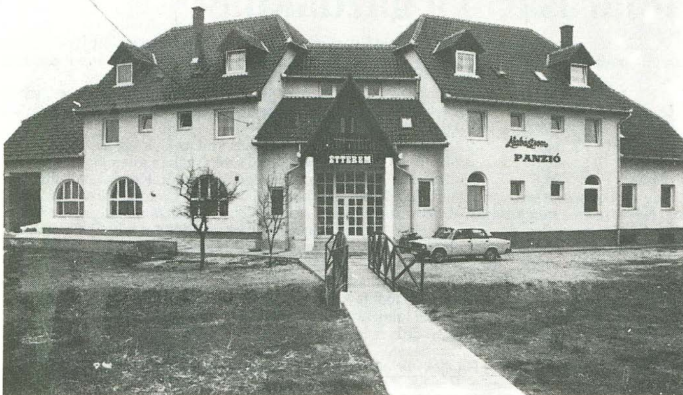
Az Alabástrom panzió Bogács egyik legszebb épülete