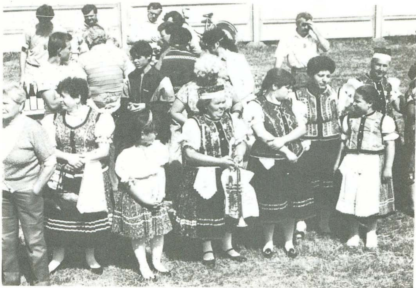
A bogácsiak nem csak énekeltek, de szívesen hallgatták a többi együttes műsorát is

Az 1993. évi Nemzetközi Dalostalálkozóra július 3–4. között került sor. Most is Bogács adott helyet a rendezvénynek, ez a hegyekkel körülvett, barátságos, Borsod-Abaúj-Zemplén megyei község. Halász Péter, a Magyar Művelődési Intézet igazgatója nyitóbeszédében Sütő Andrást idézve ezekkel a szavakkal indította el a fellépő együtteseket: „Amíg egy nép énekel, addig messzire hallatszik, hogy létezik”. A Mezőkövesd és Környéke Kulturális Egyesület és a Bogácsi Művelődési Ház által szervezett fesztiválon sok országrész képviseltette magát határainkon innen és túl. Érkeztek csoportok Tardról, Tiszatarjánból, Ostorosról, Nyírtelekről, Felsőzsolcáról, Alsólakosról, Csentéről, Gyulafirátótról, Kecelről, Ösküről, Nyíradányból, Szarvasról, Bugyiról, Novajról, Sepsiszentgyörgyből, Nyírpazonyból, Szentistvánról, Vajdabokorból, Kesztlőcről, természetesen Bogácsról és két együttes Táborfalváról – a Csutorás és a Népzenei Együttes. A népi együttesek tájegységükre jellemző, többnyire maguk által készített ruháikban léptek fel, és a júliusi hőség ellenére lelkesen és jókedvvel