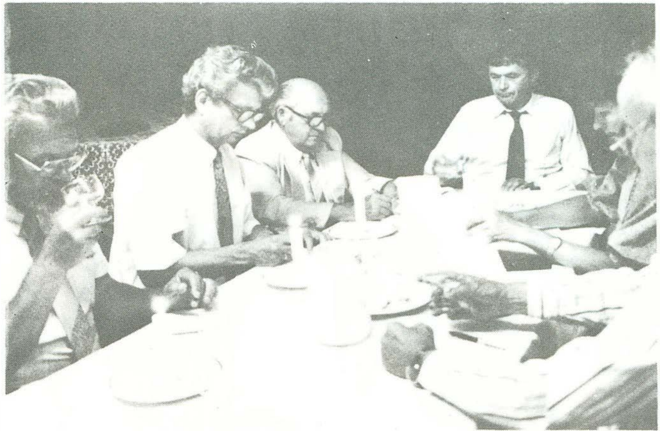
Munkában a bükkaljai fehérborok kategóriájának zsűrije