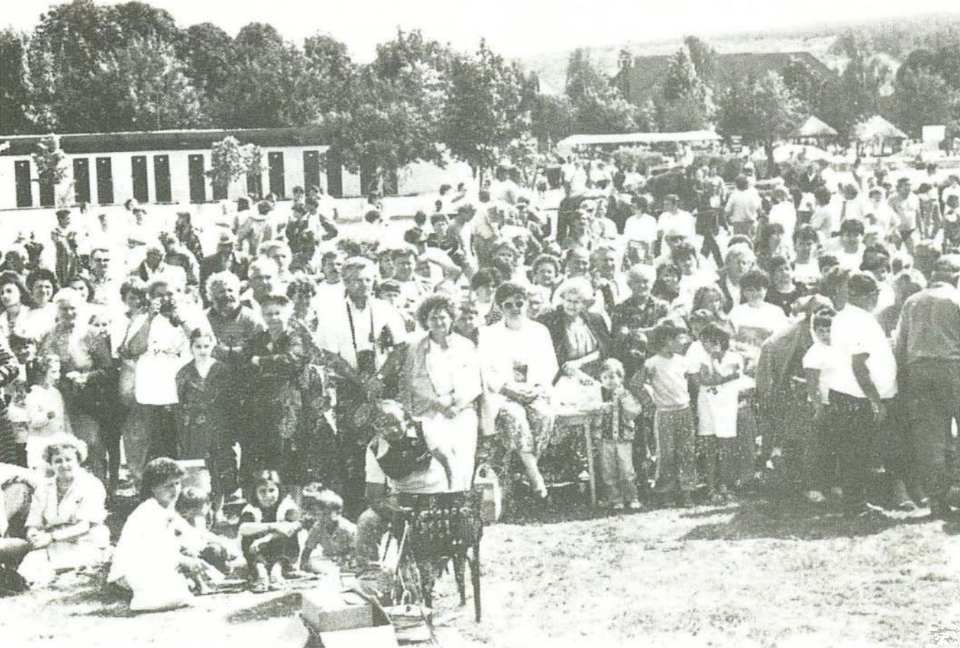
A bogácsi fürdőben érdeklődők százai hallgatták a szakzsűri értékelését