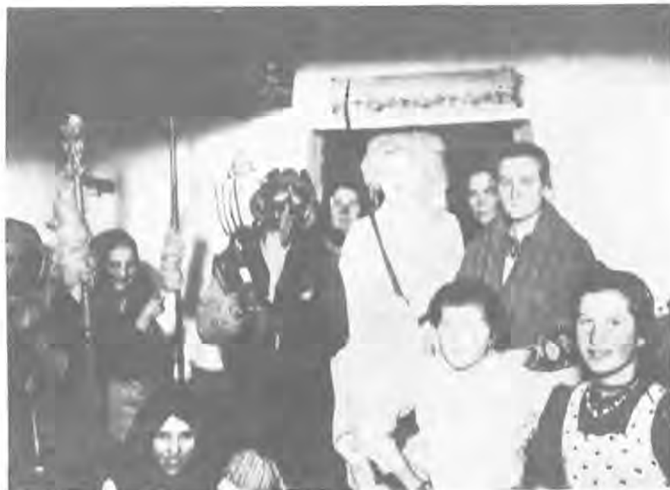
Régi bogácsi néphagyomány a fonóház. A felvétel 1936-ban készült