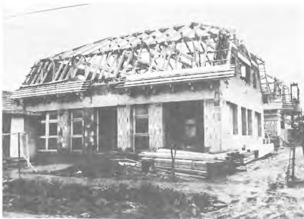
Az épülő új székház

A szövetkezet jelenleg egy önkormányzati tulajdonú épületben (volt pártház) fogadja az ügyfeleket, bonyolítja majdnem félmilliárd forintos forgalmát. Meglehetősen szűkös körülmények között. Ezért is határoztak úgy, hogy új székházat építtetnek. A Mezőkövesdi Építőipari Szövetkezet ez év szeptemberében kezdte meg a bogácsi takarékszövetkezeti székház alapozását. A kétszintes épület alul 175, felül 140 négyzetméteres alapterületű lesz. Földszintjén bonyolítja az ügyfélforgalmat, felső szintjén a takarékszövetkezeti központ kap helyet. A kövesdi építők azt ígérték: 1993 augusztusában átadják az épületet. Úgy tűnik, a határidőt tartani tudják, mert már a cserepeket rakják, így a befedett épületben a téli hideg ellenére is dolgozhatnak a szakiparosok.