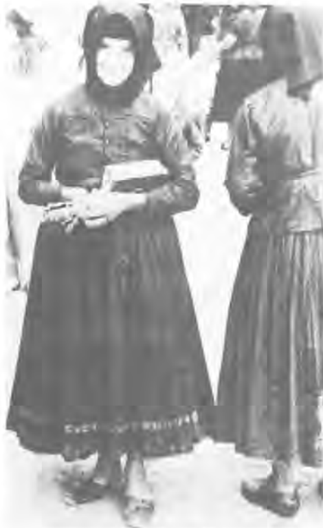
A templom előtt

Bogács a hőfürdő okán lett üdülőhellyé, ezen a címen kapott összegeket a fejlesztésre. Ma már