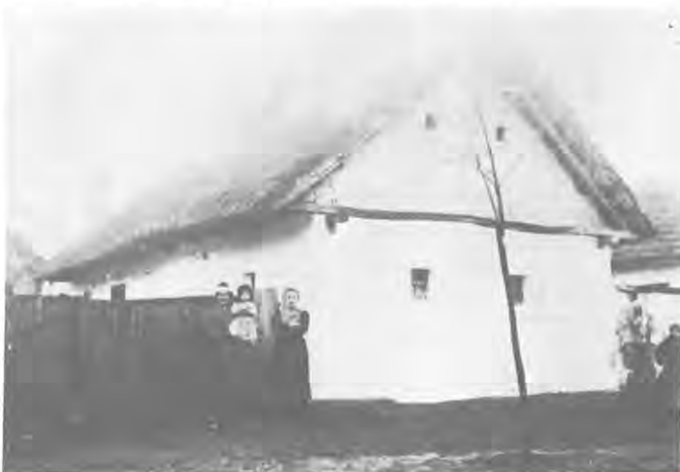
A kiskapuban. 1936-os felvétel

Nem valami éteri, lila gőzről beszélnek! Mandelstam költői szavával: „Józan varázslat is teremthet világot”, hát itt józan varázslatról van szó. Saját személyiség- és léleképítésről. Személyiségről, aminek mindig önértéke van.