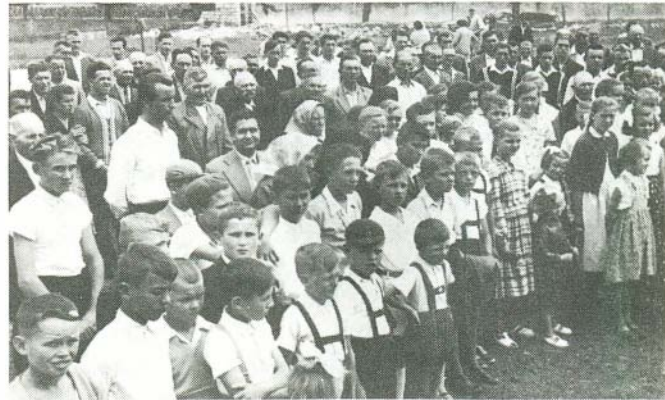
A falu apraja-nagyja ott volt az avatáson