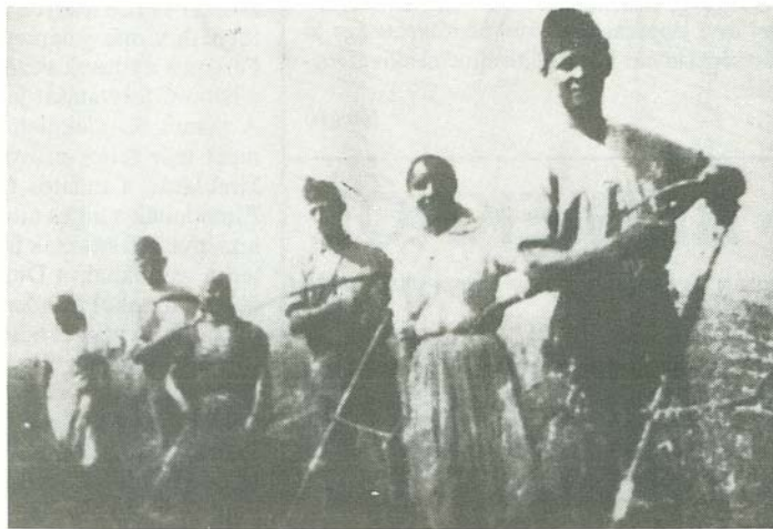
Bogácsi summások a két háború között