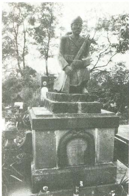
Megyénkben Bogácson avatták fel elsőként a II. világháború magyar áldozatainak emléknívét