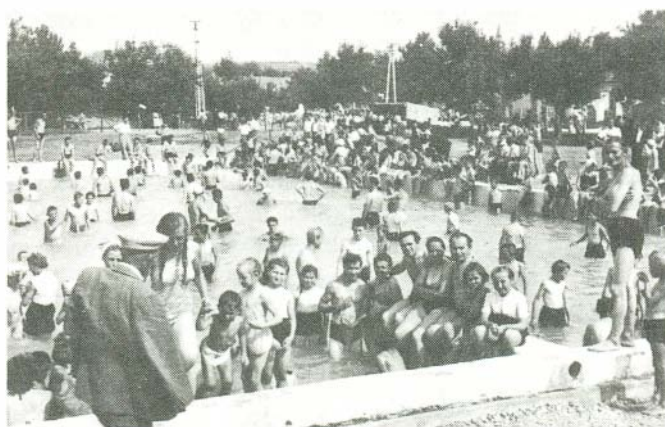
Az első fürdőzők