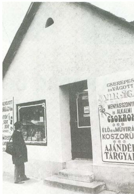
A vállalkozások korát éljük. Nem csak a tsz alakul át