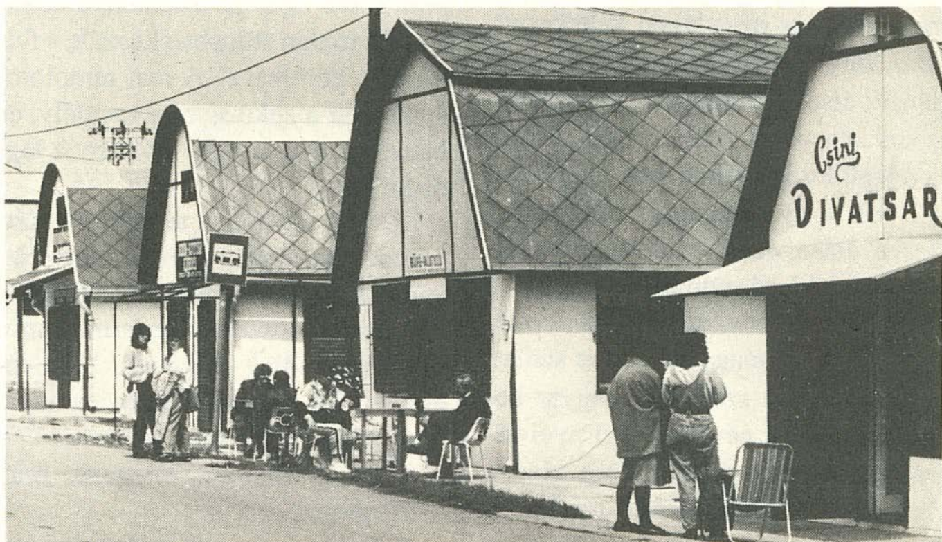
Butiksor a községnek országos és világhírnevet hozó termálfürdő előtt.