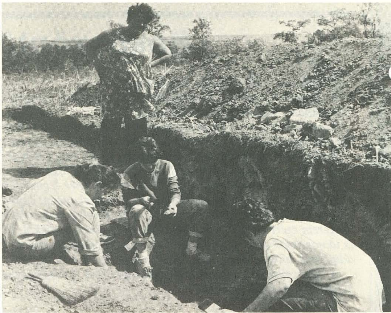
Ásatás a Pázsagtetőn 1988–89-ben. Előkerültek egy korabronzkori 3 és félezer éves ház maradványai is.